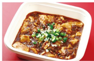
マーボー豆腐 (1人前) ¥1,700 (税込)