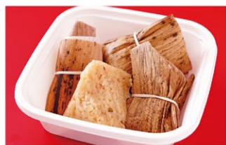
中華ちまき (4個) ¥1,600 (税込)