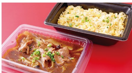
牛肉辛味あんかけ炒飯 (1人前) ¥1,800 (税込)