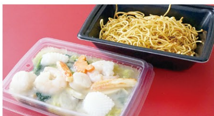
海鮮あんかけ焼きそば (1人前) ¥2,000 (税込)