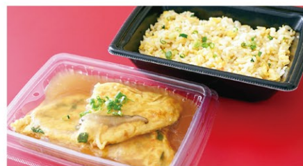
かに玉あんかけ炒飯 (1人前) ¥1,800 (税込)