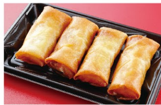
春巻 (4本) ¥1,600 (税込)