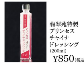
翡翠苑特製 プリンセス チャイナ ドレッシング (200ml) ¥850 (税込)

アレルギー特定原材料8品目 小麦、卵、乳成分、えび、かに、落花生を含む原材料を取り扱っております。