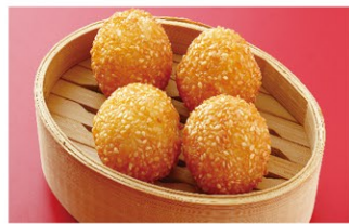
胡麻揚げ団子(4個) ¥1,600 (税込)