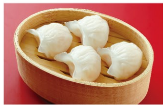
海老蒸し餃子 (4個) ¥1,200 (税込)