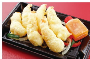
海老の衣揚げ スイートチリマヨネーズソース和え (1人前) ¥1,700 (税込)