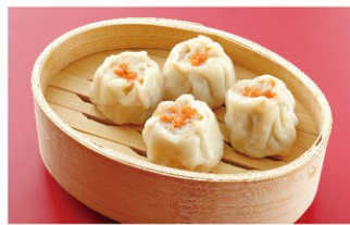
干し貝柱シューマイ(4個) ¥1,200 (税込)