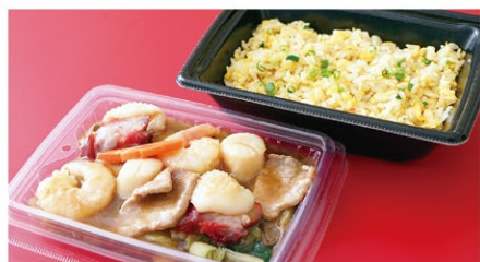
五目あんかけ炒飯 (1人前) ¥2,000 (税込)