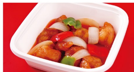
広東酢豚 (1人前) ¥2,100 (税込)