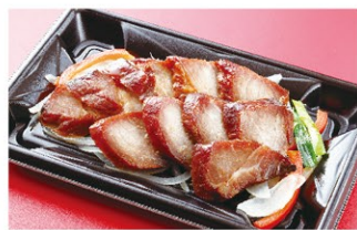
おつまみチャーシュー (1人前) ¥1,800 (税込)