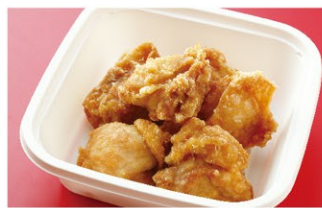
鶏の唐揚げ (1人前) ¥1,900 (税込)