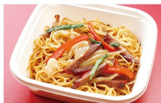
五目焼きそば (1人前) ¥1,400 (税込)