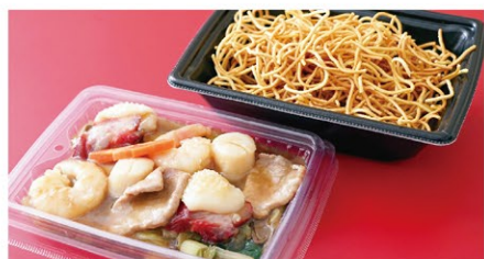
五目あんかけ揚げそば (1人前) ¥2,000 (税込)