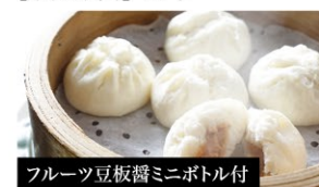
フルーツ豆板醤ミニボウル付