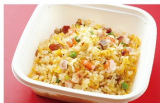
翡翠苑特製 五目炒飯 (1人前) ¥1,400 (税込)