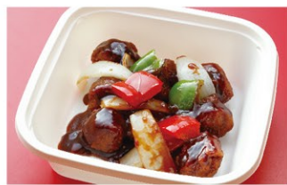
黒酢酢豚 (1人前) ¥2,100 (税込)