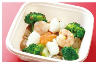
季節野菜・海老・烏賊の山椒炒め (1人前) ¥2,000 (税込)