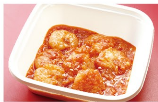
海老のチリソース煮込み (1人前) ¥1,900 (税込)